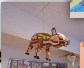
新年にちなんだ作品の数々