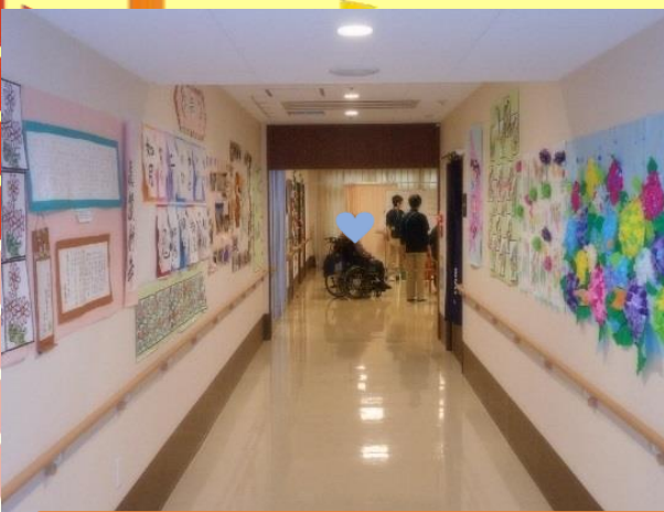
各階に色々な作品を展示